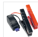
Cablu inteligent de pornire