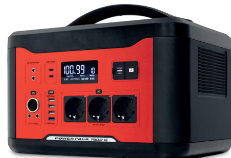
Indicatori de sarcină