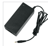
Unitate de încărcare 230 V + cablu de rețea