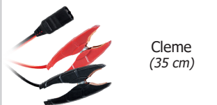
Cleme (35 cm)